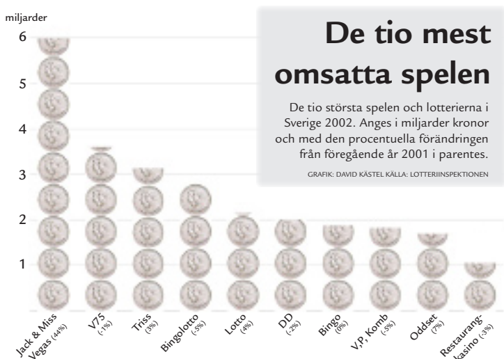
GRAFIK: DAVID KÄSTEL. KÄLLA: LOTTERIINSPEKTIONEN

De tio största spelen och lotterierna i Sverige 2002. Anges i miljarder kronor och med den procentuella förändringen från föregående år 2001 i parentes.