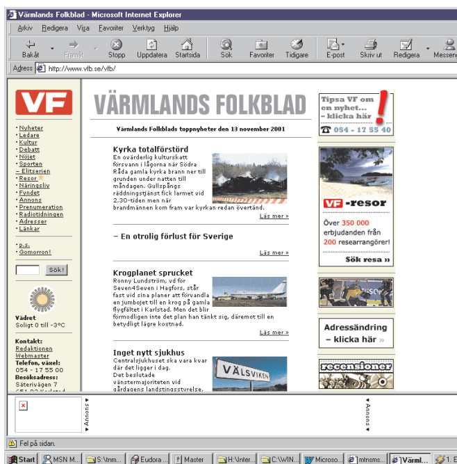
Fig. 4 Här ses Värmlands Folkblads första sida. Menyraden till höger och huvudsudan i mitten.

för denna landsortstidning är bra. Anm. Det värmländska hjärtat inom mig kan genomsyra diskussion och ge en skev bild av intrycken.